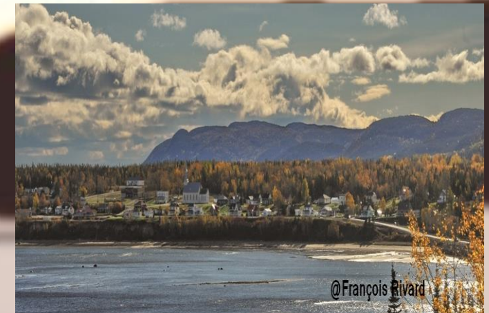
Prix de la Municipalité pour sa nomination au Prix Patrimoine 2015

La Baie-Sainte-Catherine... là où la ZÉNitude y est un art de vivre au quotidien !