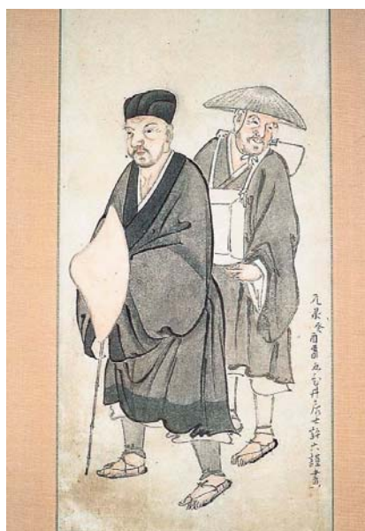
Matsuo Bashō e il suo discepolo Kawai Sogoro (detto Sora), compagni viandanti

sul sentiero di montagna al sorgere del sole il profumo dei pruni