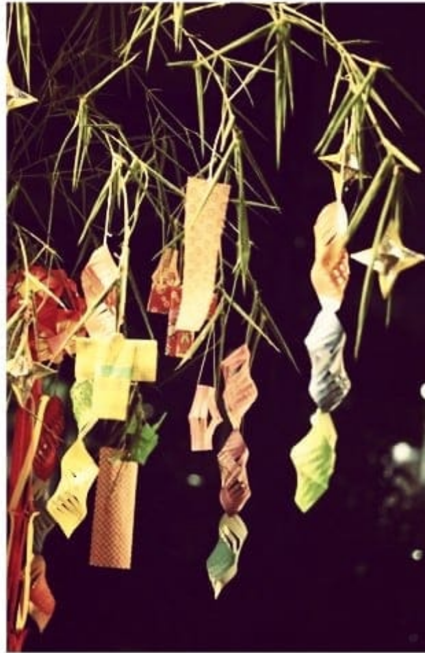
Tanabata Matsuri 2018