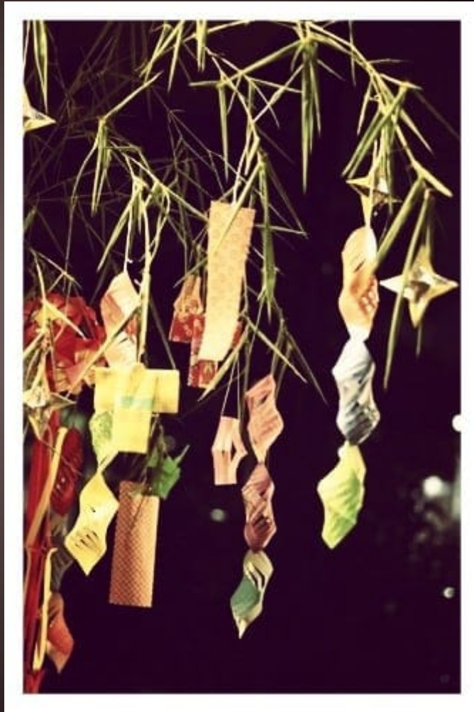
Tanabata Matsuri 2018