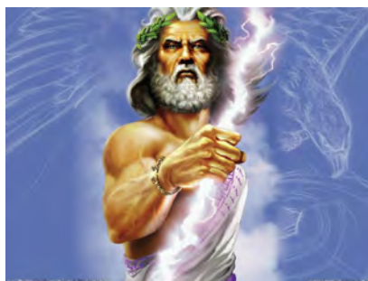
Zeus, le Dieu des Dieux Grecs

Il était une fois un Grec, un Romain et un Egyptien qui marchaient tranquillement. D'un coup, ils aperçoivent Zeus, le Dieu des Dieux. Les trois hommes s'allongèrent et prièrent pour Zeus. Mais ce dernier s'écria : « Qu'est-ce que vous faites là ?! »