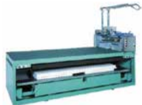
自動襖張機 パント