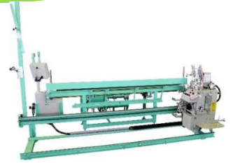
全自動反転式返縫機 ロボエース6型

ロボオートは平刺の全工程を、 ロボエースは返し （返り縫） の全工程を自動で行うため、 作業者が縁などの処理をしているうちに、ど ちらかの機械が自動縫着を行うので、作業時間 の無駄がなく生産性がUPします！