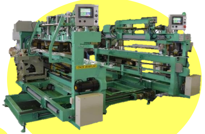
両頭式自動表張框縫機 ツインロボ52