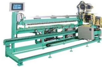
全自動反転式平刺機 ロボオート6型

両框同時裁断により作業効率がアップ！ 厚畳と薄畳の切替が簡単で、切断の角度も変えられます。