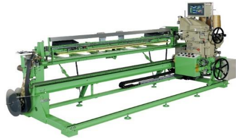
自動クセ取装置付両用機 マイコンスーパーリード6型

大幅な自動化により、同時に他の仕事ができ省力化！ 薄畳・厚畳、平刺・返し （返り縫） の切替も自動化！