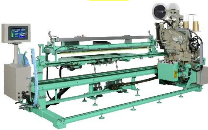
平刺返全自動両用機 ロボリード2型

ロボオートは平刺の全工程を、 ロボエースは返し （返り縫） の全工程を自動で行うため、 作業者が縁などの処理をしているうちに、ど ちらかの機械が自動縫着を行うので、作業時間 の無駄がなく生産性がUPします！