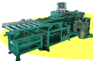
両頭式自動返縫機 ツインロボ13

短時間での生産性を追求した、生産システムの決定版！ 生産能力だけでなく、仕上がりも重視した設計！