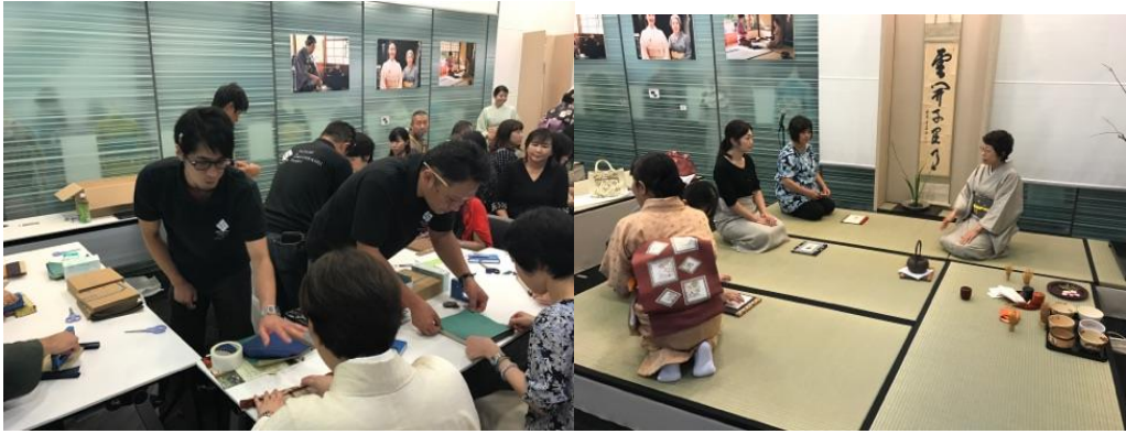
四畳半の茶室にてミニ畳盆お点前体験