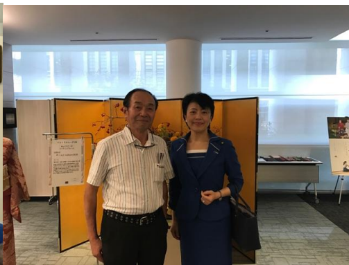
有村参議院議員も来場されました。