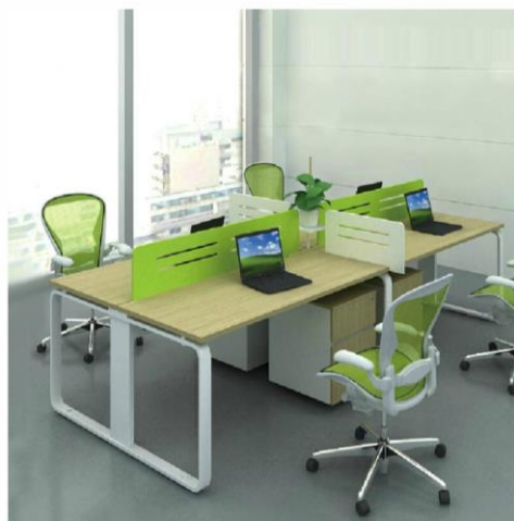
Пример рабочей зоны