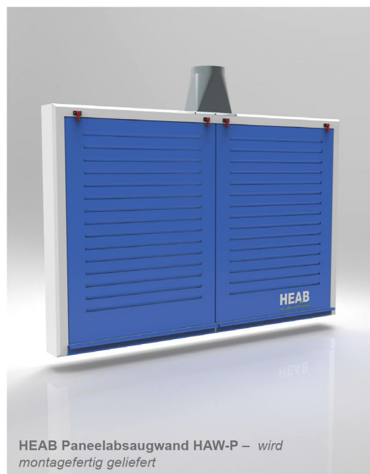
HEAB Paneelabsaugwand HAW-P – wird montagefertig geliefert

Die Paneelabsaugwand ist besonders als Schleifwand bei Schleifen mit Winkelschleifer und Exzentrerschleifer geeignet. Das Paneel ist so aufgebaut, dass die Luft über die Saugfläche verteilt wird. Die Saugfläche ist mit Stahllamellen ausgeführt. Optional ist die HEAB Paneelabsaugwand mit Decken- und Seitensatz erhältlich.