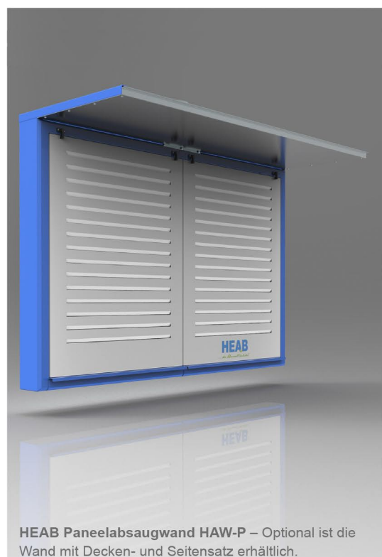
HEAB Paneelabsaugwand HAW-P – Optional ist die Wand mit Decken- und Seitensatz erhältlich.