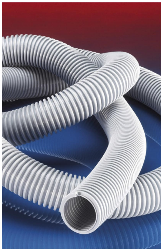
EVA 373 – Staubsaugerschlauch