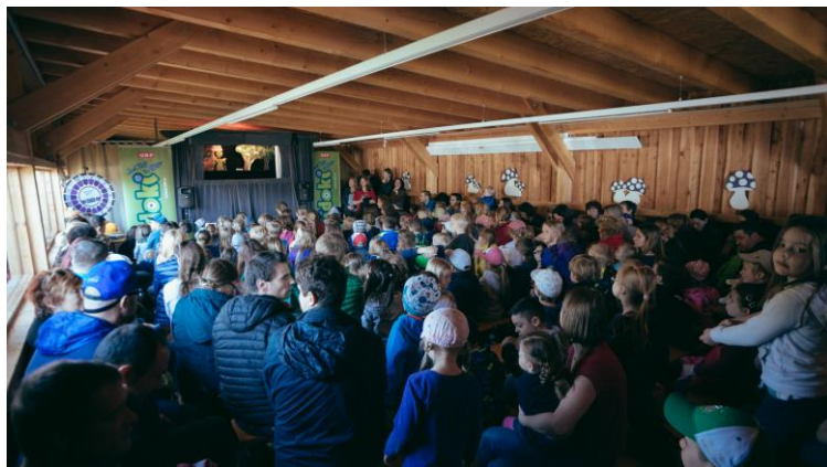
KIDS DAY in der Amethyst Welt