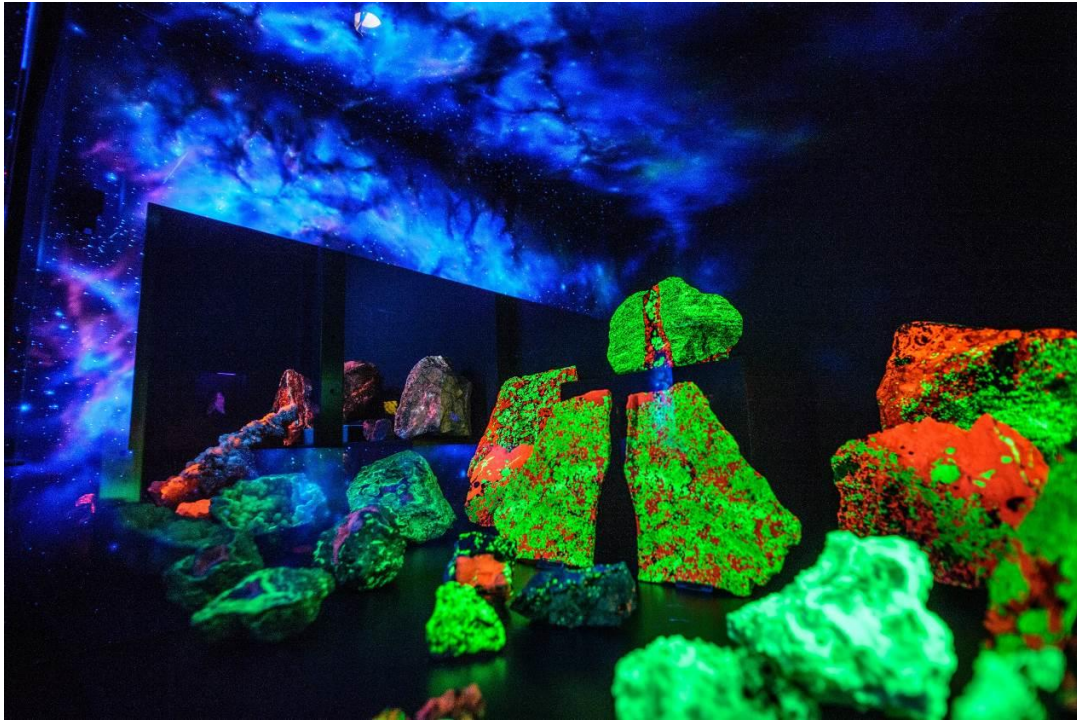
„Leuchtende Steine“ in der Amethyst Welt