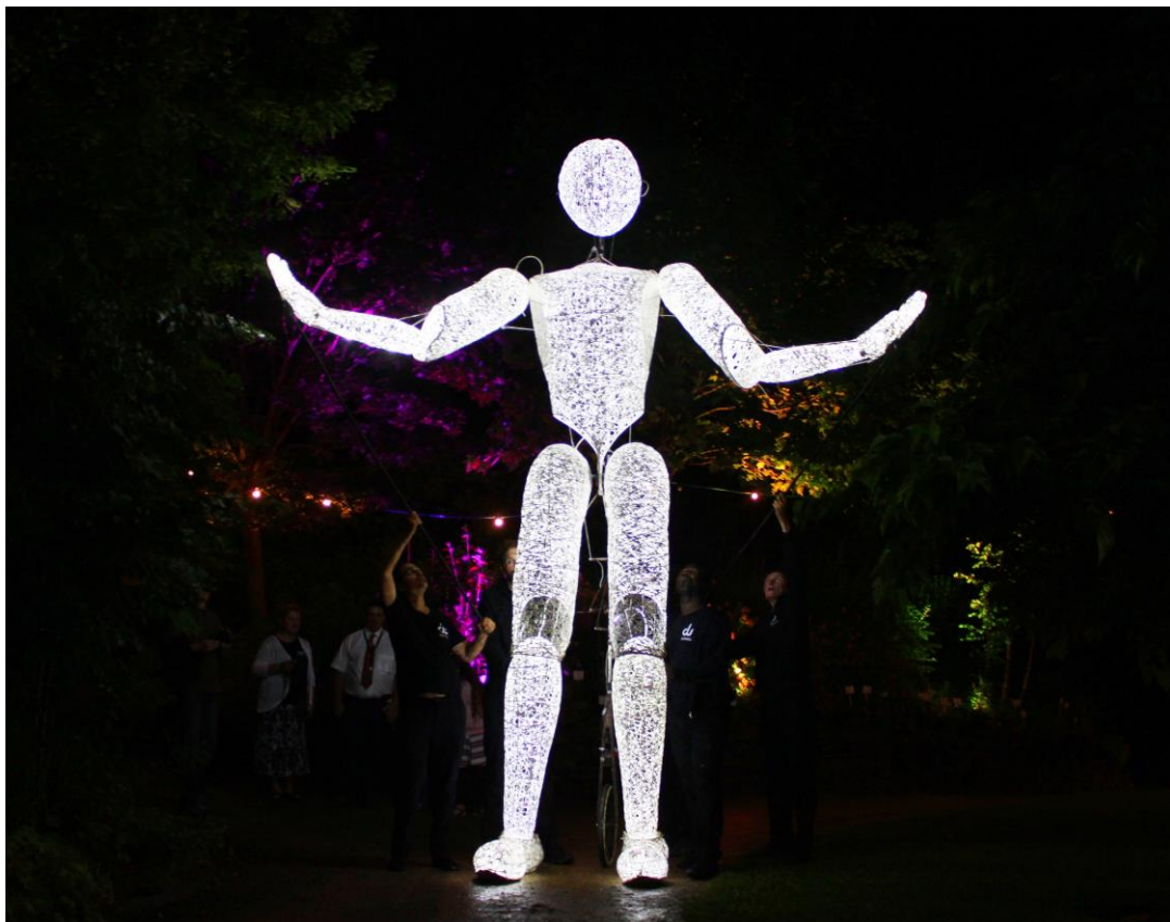
„DUNDU“ in der Amethyst Welt, Foto: Andreas Anker

Presse-Fotos für journalistische Zwecke honorarfrei freigegeben.