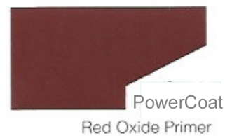
PowerCoat Red Oxide Primer