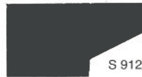
S 912 Dark Grey