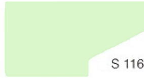
S 116 Surf Green