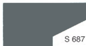
S 687 Dove Grey