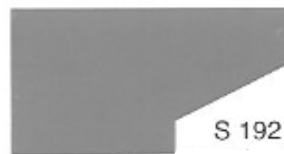
S 192 Dawn Grey