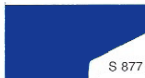
S 877 Navy Blue