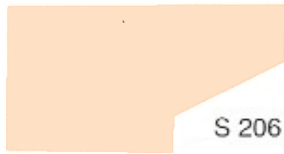
S 206 Fresh Apricot