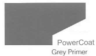
PowerCoat Grey Primer