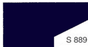
S 889 Midnight Blue