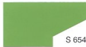
S 654 Tropicana