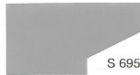
S 695 Pewter