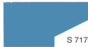
S 717 Crystal Blue