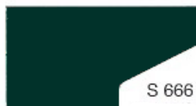
S 666 Grass Green