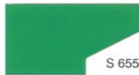
S 655 Spring Green