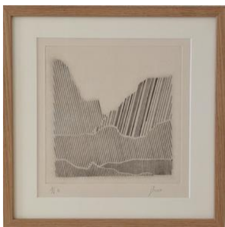
Julien Levesque Entre\Nous - 2017 estampes réalisées à partir de données de géolocalisation conservées par Google