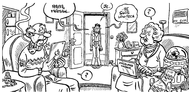
Illustration : Isa 64

Quel « technodurable » êtes-vous ? Pour vous aider à vous situer, voici un petit questionnaire en dix questions... À vos crayons (à papier) !