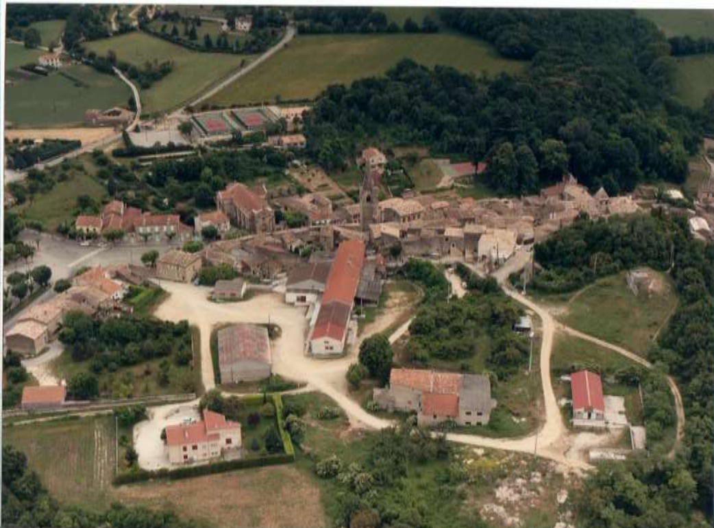
Vue Aérienne de Grâne avant la destruction des abattoirs Desbrun