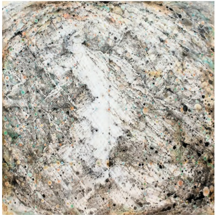
王無邪作品，《河圖》，2000年。