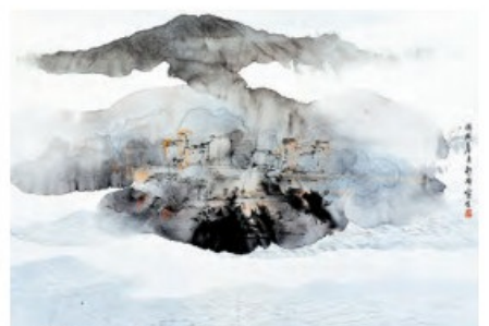
熊海作品，《香港西貢》，2018年。