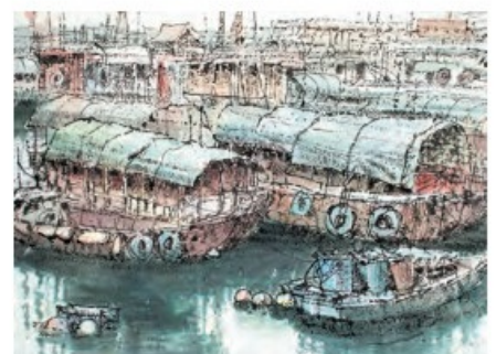
沈平作品，《維港避風塘的船》，2018年。