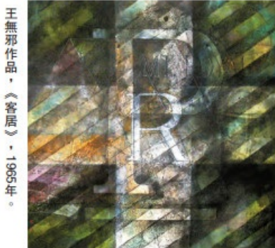
王無邪作品，《客居》，1965年。

山水作為中國水墨畫的其中一個分支，至今已演變成多種形式。本地著名水墨大師王無邪繪畫「現代水墨畫」，他喜以俯瞰的角度寫景，帶有傳統的手法，但又將畫面分割成多個幾何範圍。這種抽象之中又帶傳統的創作手法皆因王氏曾跟隨呂壽琨習畫，同時又於美國進修過美術及設計的原因。在接受本報專訪時王無邪表示：「在外國受到當時流行的當代藝術影響，包括抽象表現主義、波普藝術和極簡主義，形成與他人不同的藝術風格。」使畫作有濃墨的傾向、以字入畫且帶有幾何化的元素。是次展覽將展出他於1965年創作的《客居》，這幅水墨畫利用文字的線條及幾何的色面，表現了冷暖色調和光暗對比，正是王無邪於外國畢業後的作品。可見，他於60年代已然突破傳統水墨方式，並畫出大家熟悉的王無邪式山水畫的雛形。