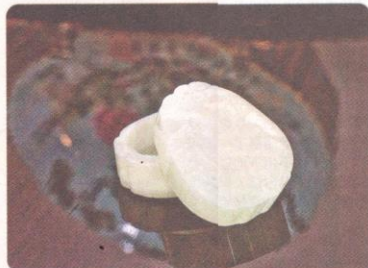
清乾隆白玉石榴形蓋盒

此盒以白玉為料，色澤柔和，玉質清潤。石榴造型寓意榴開百子，年年如意。瓜果形盒常見於竹、木、牙角器，但這盒子以白玉雕刻而成，是難得的玉雕文玩珍品。