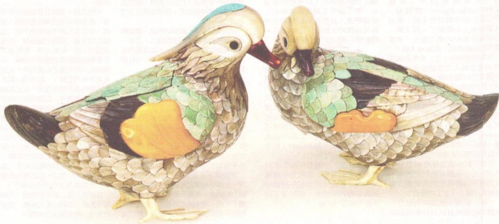
清百寶嵌鴛鴦形蓋盒一對

這對鴛鴦神態活現，饒有動感，身上鑲嵌各種不同顏色的螺鈿、綠松石、玳瑁、蜜蠟等珍貴材料，百寶嵌這種裝飾手法在動物擺件上極為罕見。