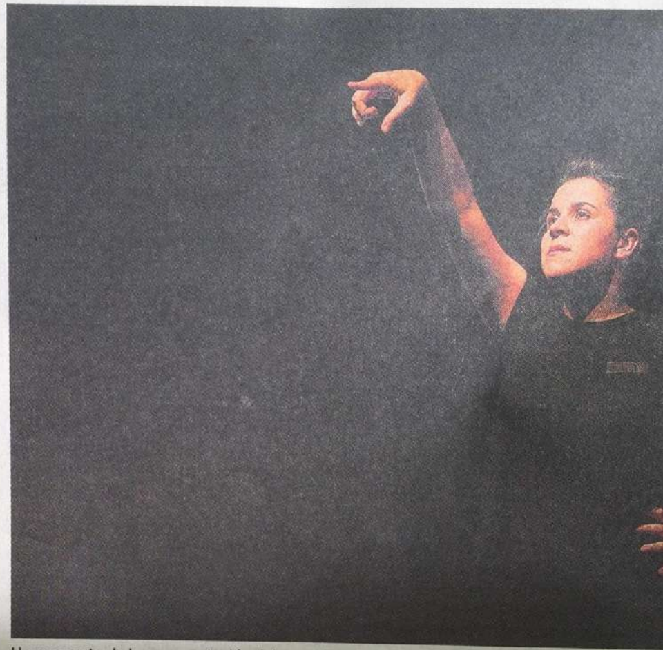
Un momento de la representación del pasado lunes en Tacoronte.