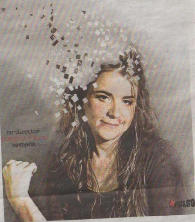
El cartel del espectáculo.