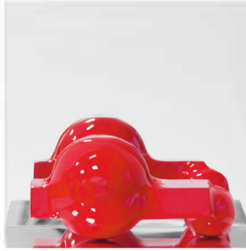
STRA//in 30x30xprof.22 legno, polimero, plexiglas 2018