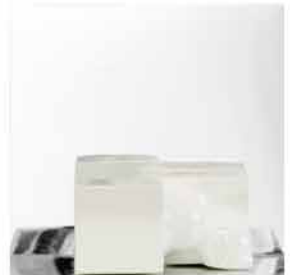
@FLAP 30x30xprof.22 legno, polimero, plexiglas 2018