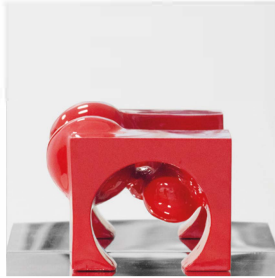
non//STOP 30x30xprof.22 legno, polimero, plexiglas 2018