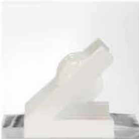
GAZE 30x30xprof.22 legno, polimero, plexiglas 2018