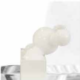
//ALTER 30x30xprof.22 legno, polimero, plexiglas 2018