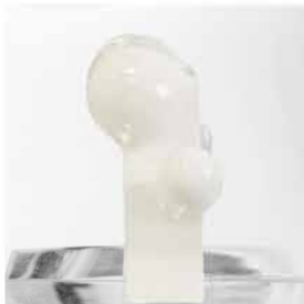
_SLAM 30x30xprof.22 legno, polimero, plexiglas 2018