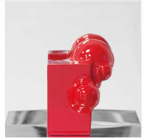
_RATIO 30x30xprof.22 legno, polimero, plexiglas 2018