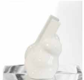
@ADO 30x30xprof.22 legno, polimero, plexiglas 2018