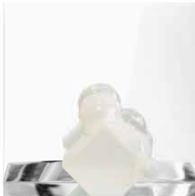
LOCK//unLOCK 30x30xprof.22 legno, polimero, plexiglas 2018