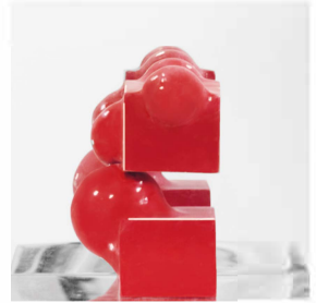
@SMASH 30x30xprof.22 legno, polimero, plexiglas 2018