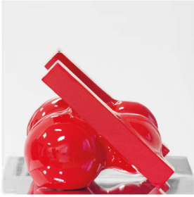
//SLOPE 30x30xprof.22 legno, polimero, plexiglas 2018