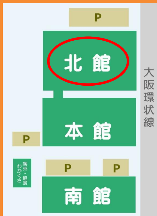
【若草第一病院 配置図】