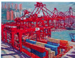
區嘉林的中環碼頭(二)。