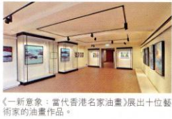
《一新意象：當代香港名家油畫》展出十位藝術家的油畫作品。