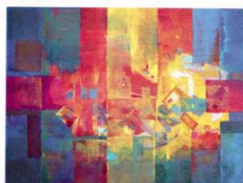
李林先的衝突與包容。