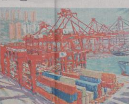
▲看者《南生圍小溪》那成列的棧橋，叫人聯想到《貨櫃碼頭》。圖為香港活潑的貨櫃埔

【大公報訊】記者林巧茹報導：新世紀的視察藝術方向無限的可能性。一新美術館自五月開館以來的第二個展覽「新氣象」當代香港名家油畫」展出十位香港油畫家，合共四十幅作品，把讀者帶回不同時空的歷史變遷及風情，組觀各個香港故事，各畫家的風格不一，技巧多端，給人一新耳目。