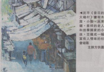
▲沈平《舊日的大崗村》畫有木屋、小街、水果舖、慈祥的老人和放學歸家的小孩，交織成一幅富有人情味的社會縮影