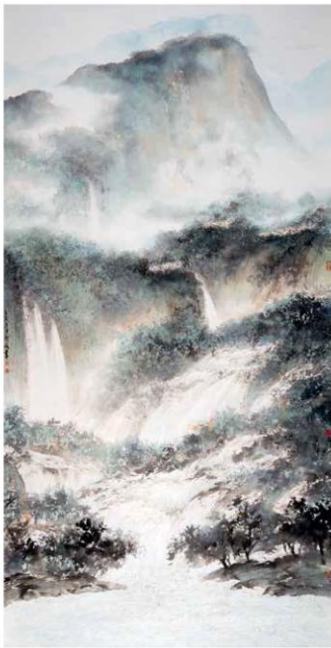
德天瀑布，2012年 水墨設色紙本 187 x 97 cm