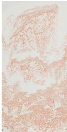
華山圖 ， 2016年 水墨紙本 131 x 65 cm

如果說法國是促使他衝破自我的催化劑，那麼華山之旅可以說是讓他追求改變的啟蒙。1995年第一次親身見證過華山的壯麗後，熊海的畫風亦隨