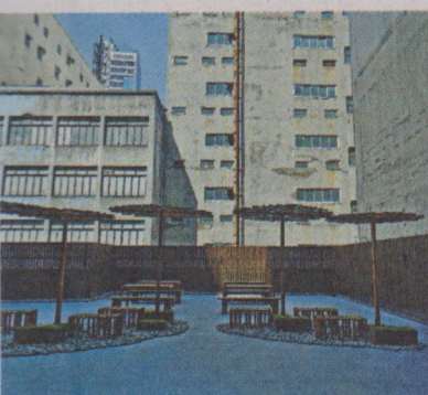
● 室外平台是美術館延伸，視野開揚。