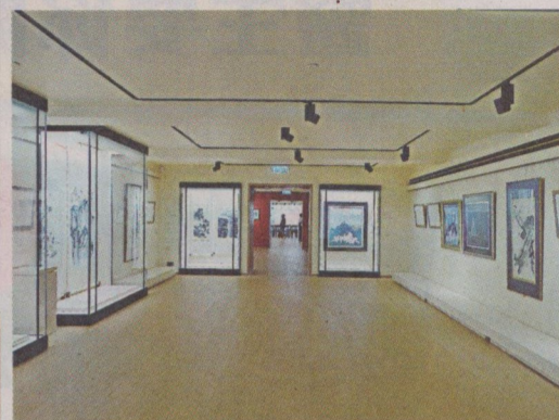
● 一新美術館總面積約一萬二千五百平方呎。