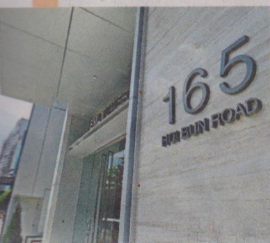
● 一新美術館坐落觀塘海濱道，有美麗海景作點綴。