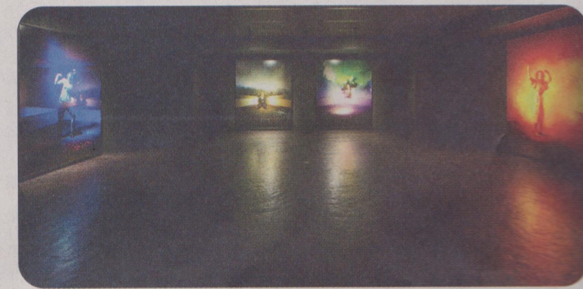
黑色實驗 The Empty Gallery 內部全黑空間，與一般畫廊的純白空間截然不同。