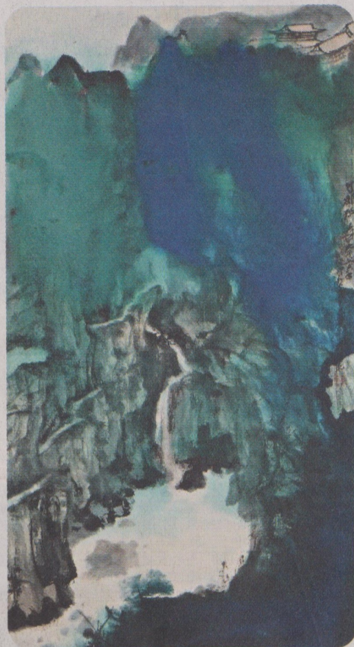
張大千 一新美術館是次展覽其中一件展品：張大千的《觀泉圖》（1963年）。