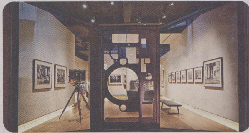
攝影博物館 位於跑馬地的F11攝影博物館地下展覽區。