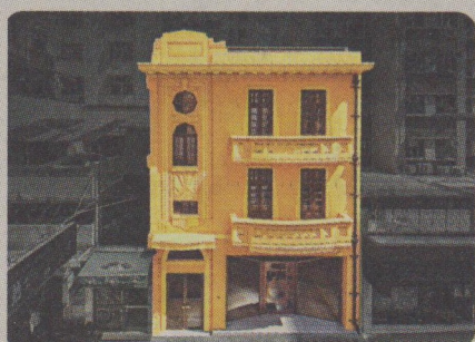
三級歷史建築 F11攝影博物館選址在一棟三級歷史建築物。