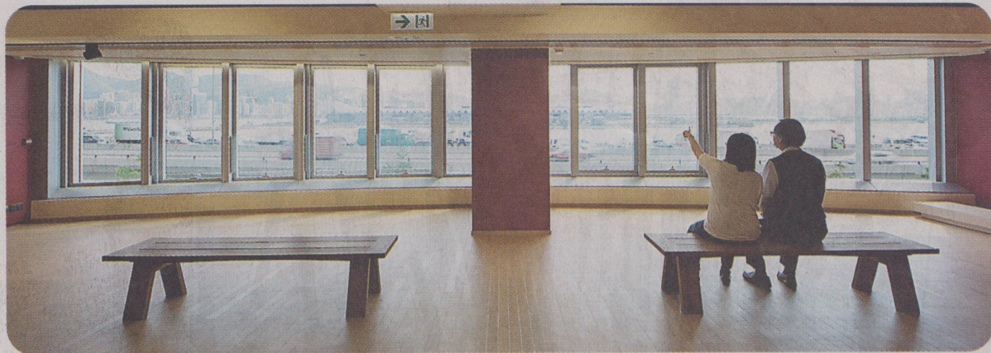
今天開幕 今天正式開幕的「一新美術館」位於觀塘商廈，佔地約12,500平方呎。