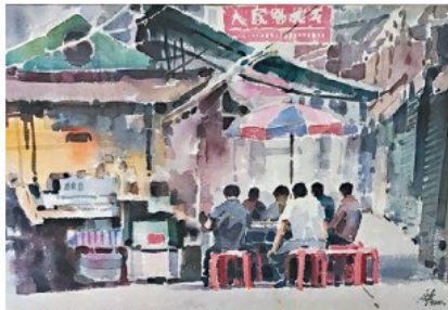
■ 《香港大排檔》水彩紙本 2011

——新美術館總監楊春棠介紹道，沈平最擅長繪畫形式的水彩畫。「翻查香港藝術史，水彩畫可說是香港藝術的先鋒，自十九世紀下半葉便傳入香港並流行起來，當時香港畫家畫的水彩畫是遊客最喜愛的手信之一。擅長水彩畫的沈平一方面繼承了香港的藝術傳統，另一方面他又將在內地學到的扎實繪畫根基帶到香港。水彩畫又最適合用來表達光影，而沈平一生中在不同地方旅居過，因此在他畫中不同的太陽光都表達了他對不同地方的情感，而當中又以他生活了37年的香港和生活了17年的新疆使他感受最深。此次展覽名稱《沈平的藝術：兩地畫》的靈感則是來自魯迅的文學書信