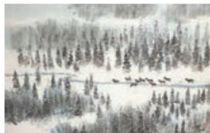
■《新疆 深山小溪》水墨設色紙本 2016

現任香港畫家聯合會副主席的沈平生於北京，年少時在上海長大，在16歲時離鄉背井加入了新疆兵團。但最後他卻被安排