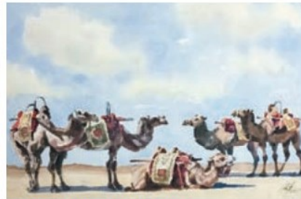
■《新疆 沙漠之舟》水彩紙本 2015

題材，沈平又特別沉醉於香港的風土人情。他努力捕捉本土特色，由舊式的樓宇街道、樸實的離島郊區，以至香港小市民的生活百態，皆是他的寫生題材，像攝影般記錄人與街道和建築物的關係。「有時候我走過中環，發現摩天大廈對面竟然是大排檔，並且坐滿了穿西裝的食客。這種反差就是生活在香港的都市情趣，草根精神總是深深植根這個同時是國際都會的地方。」