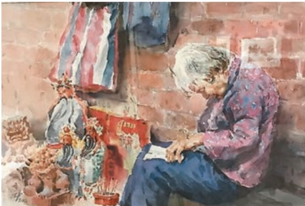
■ 《香港榕樹頭老婦》水彩紙本 2002

當兵團的美術員。「當年我什麼也要畫，年畫、宣傳畫、版畫、水墨畫、素描……但或許就是當年的訓練，令我明白到不同形式的藝術都是相通的，並為以後的繪畫生涯奠定了堅實的基礎。」展覽會場就展出了不少當時沈平的作品，明顯與沈平