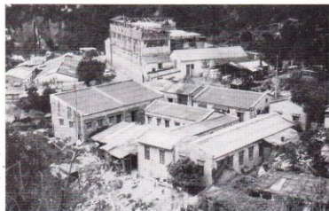
攝於粵東磁廠大窩坪舊址。