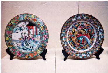
粵東磁廠其中兩隻最早期的瓷碟。