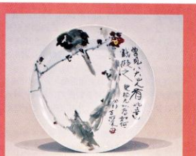
楊春深繪《彩彩手繪花鳥大盤》。