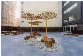
一新平台「不一樣的淨土」。