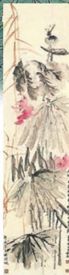
■《紅荷蜻蜓》，饒公寫紅荷，趙少昂補蜻蜓