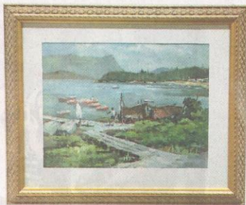
▲歐陽乃沾《烏溪沙漠風景》