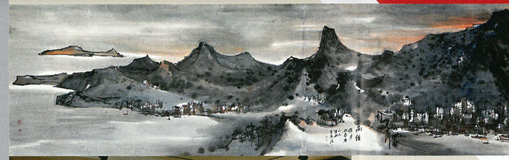
呂壽琨的《雨後維港》是展覽中最大型的作品，以俯瞰視角寫水墨。