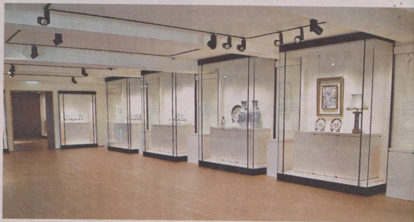
一新美術館的「港彩傳奇：粵東磁廠」展覽現正舉行。