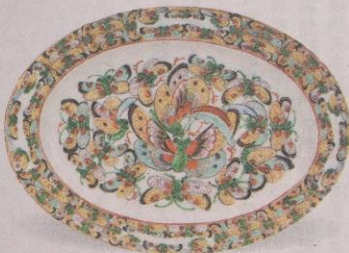
1940至1950年製作的廣彩手繪百蝶大盤，蝴蝶是廣彩常見的圖案之一。