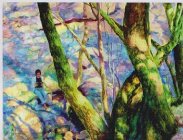
鄭高華的《消暑》（1998，51 x 66cm），寫出綠色園林與觀眾共鳴。