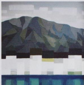
徐志鉅的《村》（2016，60 x 60cm），以獨特的幾何圖案來構圖，別樹一格。