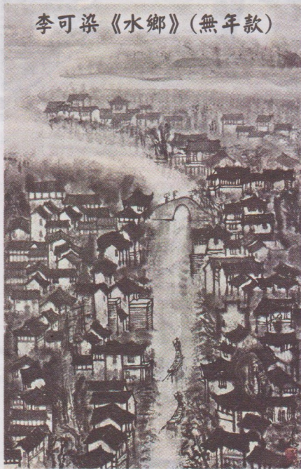
李可染《水鄉》(無年款)