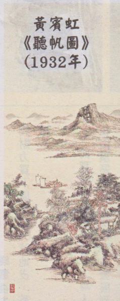
黃賓虹 《聽帆圖》 (1932年)