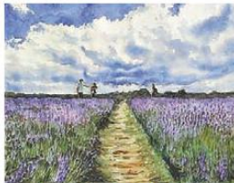
黃仲民作品《格魯亞的山村》

談起內地和香港的水彩畫發展有無差異時，她表示：「內地始終地方比較大，每年均有經常性展覽，展覽辦得最多，自然亦更容易推廣，而且多舉辦展覽，