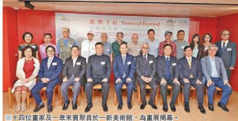
十四位畫家及一眾來賓聚首於一新美術館，為畫展揭幕。

有助畫家之間互相學習，才會進步得快。」她認為香港畢竟地方小，能辦不同的展覽已很不錯了。