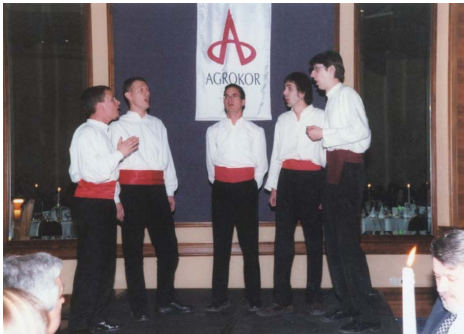
Slika 1. Klapa Iskon

Splita, koja je posebno oduševila strane sudionike, koji nisu bili upoznati s tim dijelom hrvatske kulture.