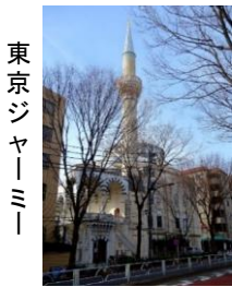
東京 ジャー ミー

渋谷区は若者の街だけではない多くの魅力にあふれています。皆様の知らない渋谷の多彩な魅力を訪ねてみましょう。まず、国内最大のイスラムモスク「東京ジャーミー」を見学します。その後、東大駒場キャンパスを散策。お洒落な街「代官山」に踏み込むと、緑豊かな「西郷山公園」やいくつもの大使館、お洒落なお店も見られます。約7km