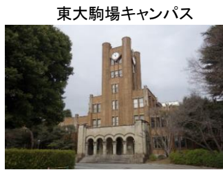
東大駒場キャンパス

小田急線・代々木上原駅(9:50)→東京ジャーミー→(駒場公園など:桜の時期ならお花見)→東大駒場キャンパス→駒場の学校群→大使館(マレーシア・エジプト)→西郷山公園→代官山駅(解散13時頃)