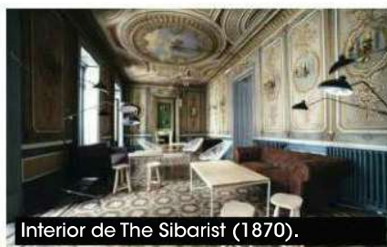
Interior de The Sibarist (1870).

La entrada a todos estos edificios es libre esos días, pero hay algunos, como el Banco de España o la Cámara de Comercio-Palacio de Santoña, que requieren de inscripción previa por tener restricción de visitas. Días 1 y 2 de octubre. Inscripciones para los edificios restringidos en openhousemadrid.org