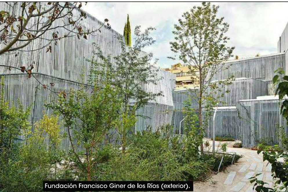
Fundación Francisco Giner de los Ríos (exterior).