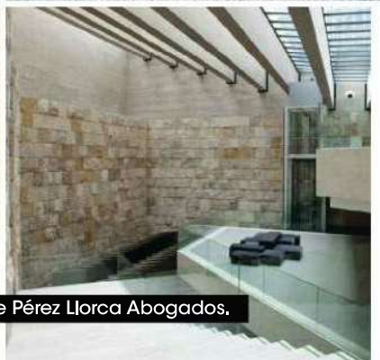
Edificio de Pérez Llorca Abogados.