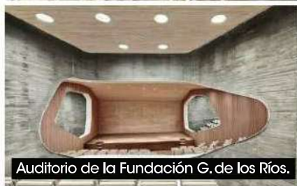
Auditorio de la Fundación G. de los Ríos.