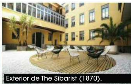
Exterior de The Sibarist (1870).