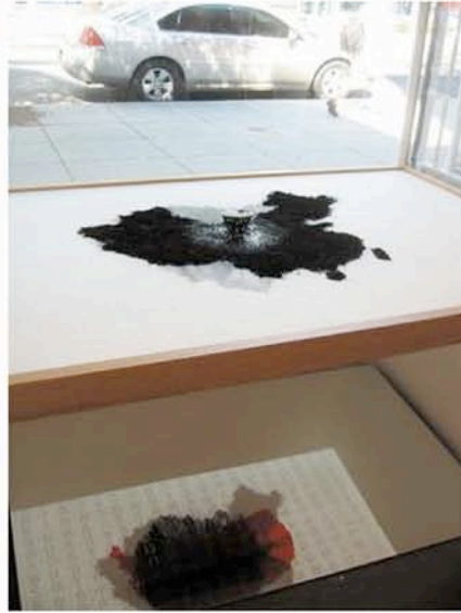
圖片 2 / 2 戴光郁的「帝國世界」，滴水蠶墨，上面的中國地圖和下面反射的易經篇章，呈現「進行」中藝術體的變化趣味。

以蔡秉橋、陳劭雄、戴光郁三位北京藝術家創作為焦點的「水墨風雲」特展 (Ink Storm)，正在華府Transformer藝廊舉行，特展以影像與多媒體藝術創作為主，凸顯當代北京青年藝術家的現實青春，及放蕩不羈的創作風格。