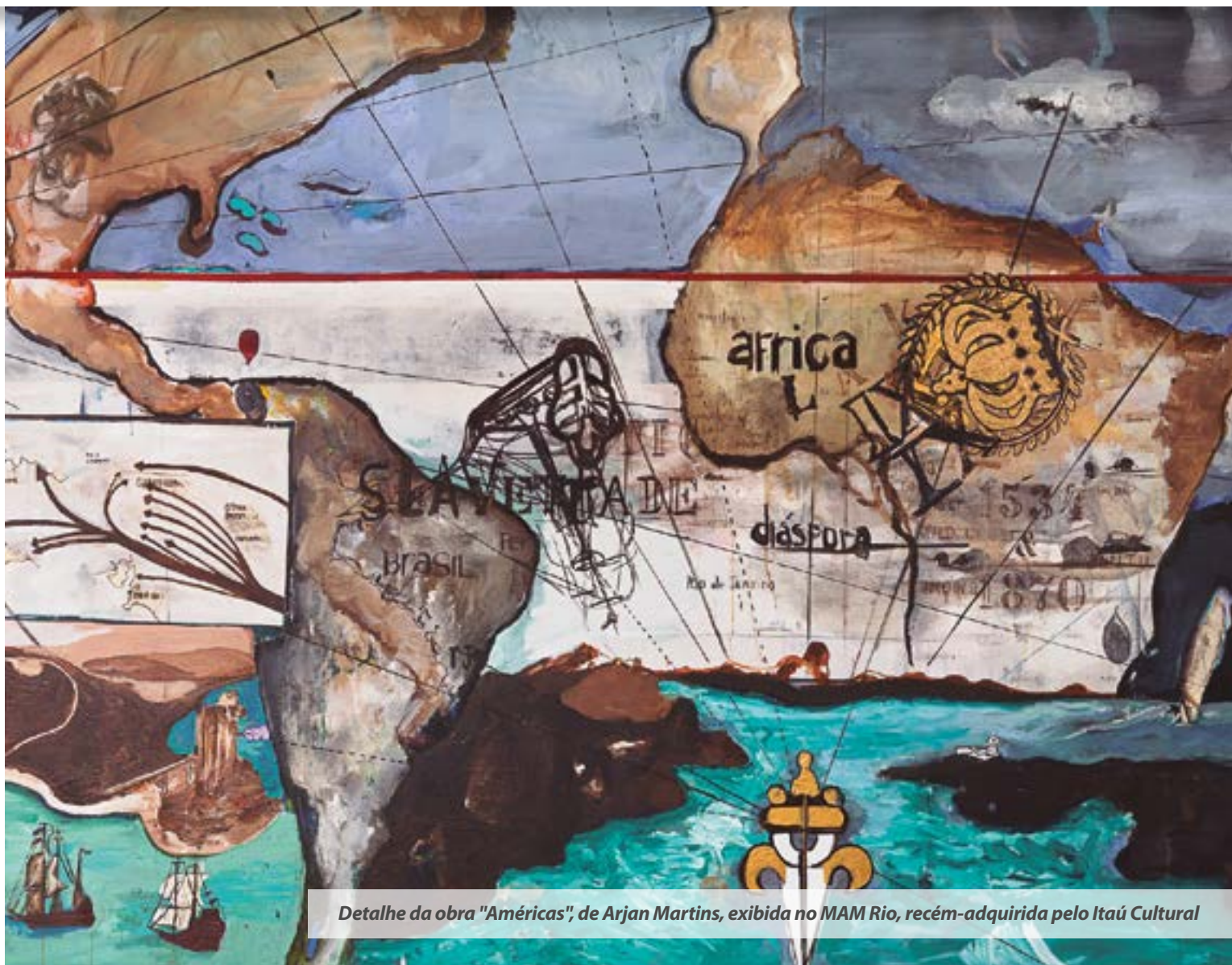
Detalhe da obra "Américas", de Arjan Martins, exibida no MAM Rio, recém-adquirida pelo Itaú Cultural