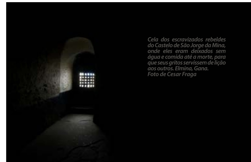
Cela dos escravizados rebeldes do Castelo de São Jorge da Mina, onde eles eram deixados sem água e comida até a morte, para que seus gritos servissem de lição aos outros. Elmina, Gana.