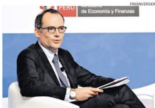
En la región. El bajo número de inversionistas es otro de los problemas para un mayor desarrollo del mercado de capitales, dijo García Mora.

Ello, a pesar de que se estima que la región tiene todo lo necesario para desarrollar este mercado, dijo García Mora. Entonces, ¿por qué no se está avanzando a una mayor velocidad?