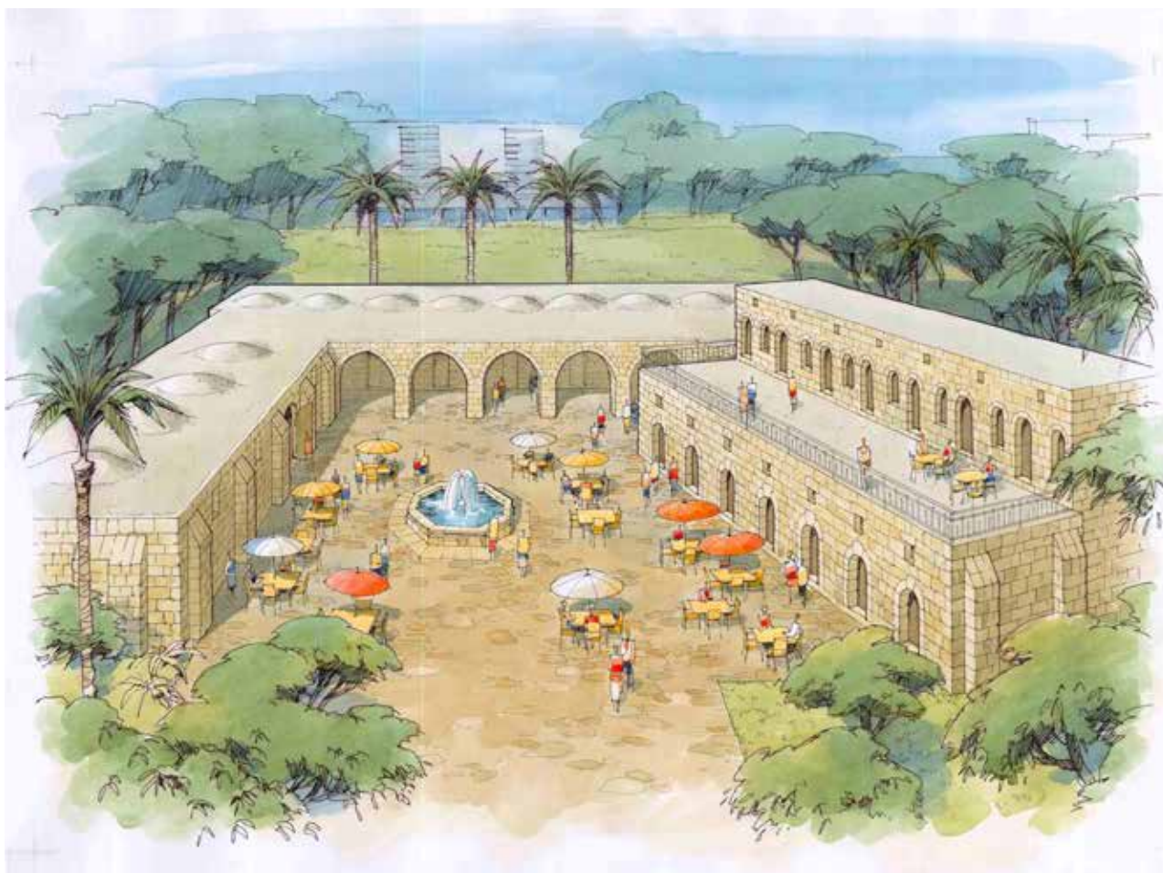
איור 4 | ח'אן אל-חילו, המחשה לאחר שחזור והפעלה