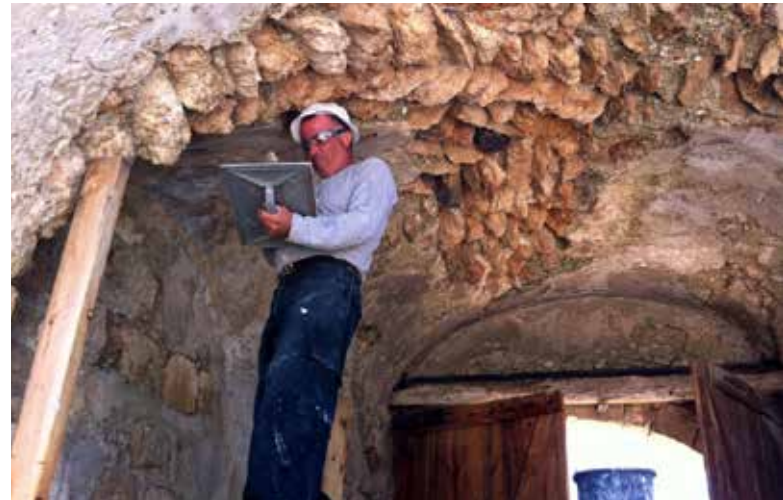
איור 8 | שימור תקרת בית השער של ח'אן אל-חילו

עשרות מיליוני שקלים. עד שנגייס את התקציבים הנדרשים, מרוכז המאמץ בייצוב המבנים, במטרה לעצור את תהליכי ההרס שלהם. (איור 8)