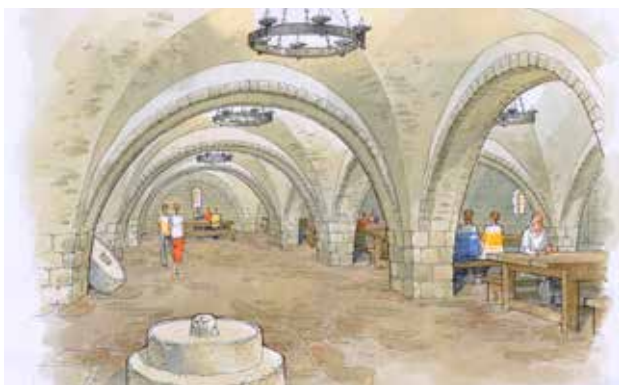
איור 6 | בית הקשתות, המחשה לאחר שחזור והפעלה

משפחת חסונה, מהמשפחות הוותיקות בעיר, שהם סמל לדורקים בין ערבים ליהודים בלוד במהלך הדורות. האתר יציע למבקרים לרכוש שמן זית, מוצרי טחינה וחלבה, וסבונים טבעיים ומסורתיים (איילון תש"ן: 176-181). (איור 5)