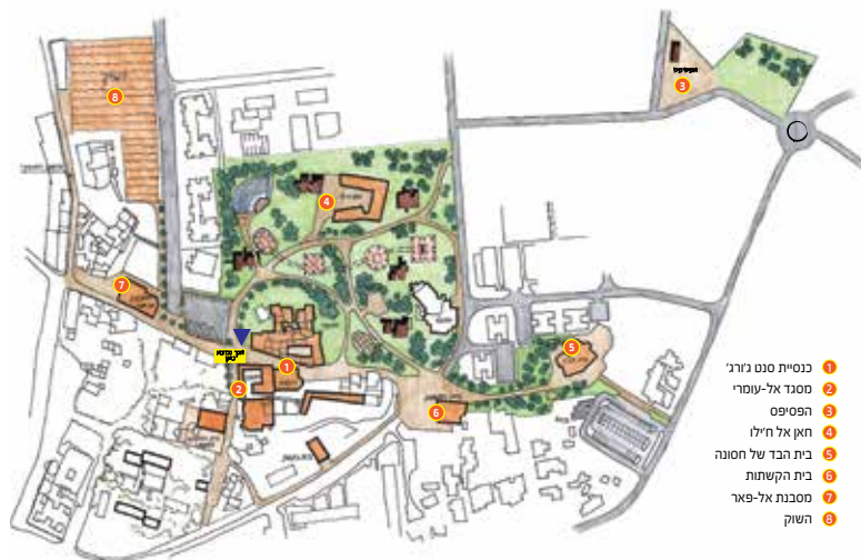
איור 2 | תכנית רעיונית לפיתוח לוד העתיקה