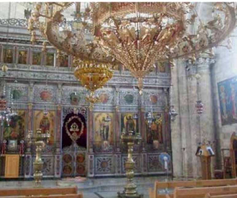
איור 3 | כנסיית סנט ג'ורג'

< מסגד אל-עומרי - מסגד מהתקופה הממלוכית ובו שרידים קדומים של הבזיליקה הצלבנית. במסגד הוצבו עמודי גרניט ושיש, אשר על אחד מהם כתובת יוונית: "הכוהנים יראי השמים היושבים בראש העיר, ואשר עליהם נוגה אורו של ישו, מקדמא דנא, הם מקשטים מקדש מהולל זה". הכתובת מרמזת שהעמודים שימשו כנסייה ביזנטית שהייתה ככל הנראה במקום.