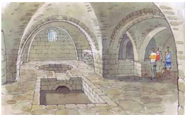
איור 5 | בית הבד של חסונה