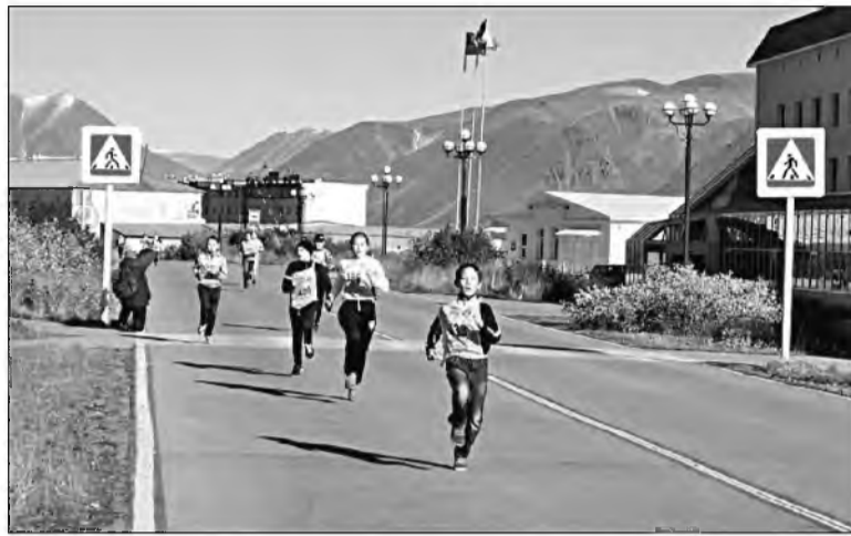
↑ Изюм всех сил: последние десятки метров перед финишем.

Если чукотская погода удивляет, так удивляет! Последние недели шли проливные дожди, хмурилось небо, а в прошлую субботу, на которую было назначено массовое мероприятие, денек стоял погожий: на небе – ни облачка, ветерок – легкий, освежающий. Не удивительно, что участники спортивного забега оделись разнокалиберно: на малышах теплые куртки и шапочки, на бегунах возрастом постарше – бриджи либо шорты и футболки.