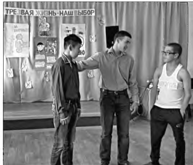
↑ Инсценировка сказки, в которой участвуют школьники.

агитбригады, занимательно для подростков, понятно и доступно для ребятшек начальных классов.