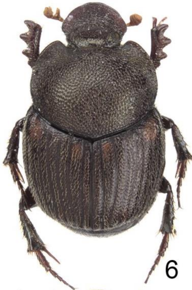
Fig 6 : habitus