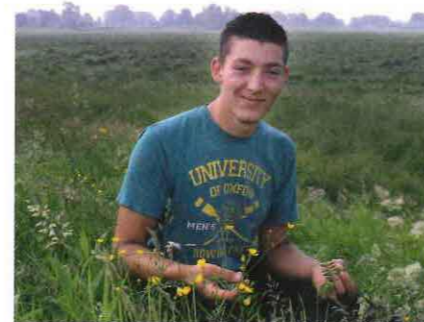
Op alle percelen ligt een vorm van beheer. De vergoeding loopt op tot €1.535 per hectare en €125 per nest.

De koeien staan in de winter in een ligboxenstal. Een deel daarvan is voor de kalveren omgebouwd tot potstal. De koeien worden natuurlijk gedekt met een goedgekeurde stamboekstier die De Willigen betreft uit het Lakenvelder-netwerk. "De populatie Lakenvelders is relatief klein met een kleine drieduizend dieren. Inteelt ligt op de loer. Daarom zoeken wij elke twee