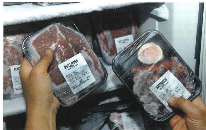
Het vlees van de Lakenvelders wordt aan huis verkocht. Veel klanten komen uit het nabijgelegen Leiden.