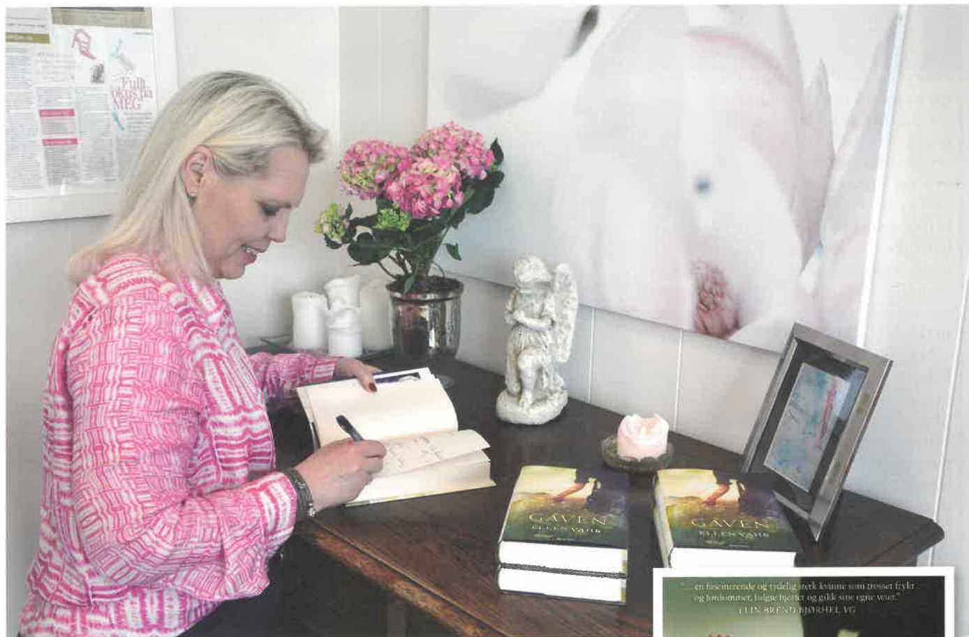
Ellen signerer bøker.

veis dit får hun en åpenbaring: Hun har jo gaven sin! Om alt annet er tatt fra henne, kan ingen frarøve henne den! Med ringen i lommen drar hun i stedet til en av de to kloke konene i Christiania. Den ene arbeider for de rike, den andre for de fattige. Anne drar til bydelen Kampen, der kvinnen som hjelper de fattige holder til. Hun tilbyr sin hjelp og får jobbe der.